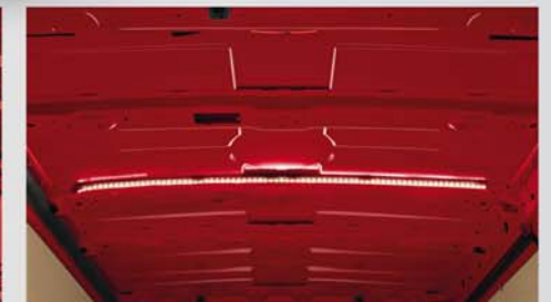
Laderaum-Beleuchtung, LED (29)