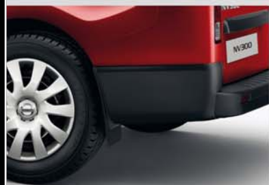
Schmutzfänger vorne und hinten (110, 111)