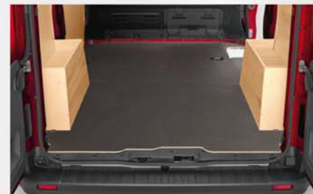
Robuster Anti-Rutsch-Holzboden (93)