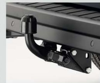
Abnehmbare Anhängerzugvorrichtung (Set) (40)