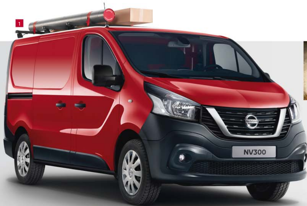
1 - Aluminium-Dachträger-Querstreben (123)

Mit seinen robusten Trittstufen, der dazugehörigen Leiter* und diversen Dach- und Querträgern ist der NISSAN NV300 zu allem bereit. Sein durchdachtes Karosserie-Schutzzubehör hilft Ihnen dabei, ihn bestmöglich vor Schäden zu bewahren – auch wenn es in Ihrem Arbeitsalltag einmal härter zur Sache geht.