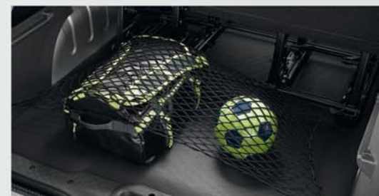
Horizontales Laderaum-Gepäcknetz (61)