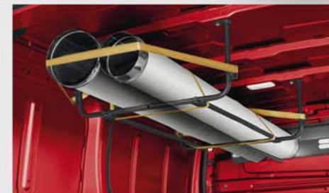
Halterungen im Dachhimmel innen (62)