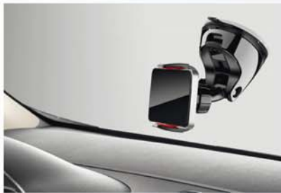
Smartphone-Halterung, 360° drehbar (35)